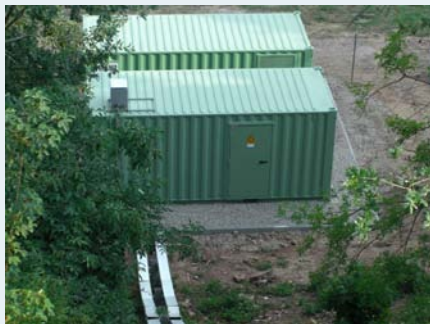
Individuell konzipierte Wechselrichter- und Trafostation